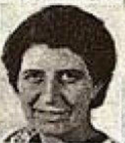
Maria Jovinone (socialista)

Teresa Noce, nata nel 1900 a Torino fu segretaria di Luigi Longo, vice-comandante del Corpo Volontari della Libertà e una delle rappresentazioni di un'attività politica di movimento femminile, al quale ha dedicato tutta la sua azione da deputata, operaia, partecipò ai primi scioperi, e poi nella sua attività