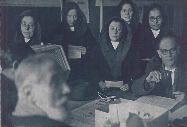
DOPO 25 ANNI GLI ITALIANI TORNANO LIBERAMENTE ALLE URNE; TRE MOMENTI DELLE ELEZIONI AMMINISTRATIVE IN UN PICCOLO COMUNE DEL LAZIO.