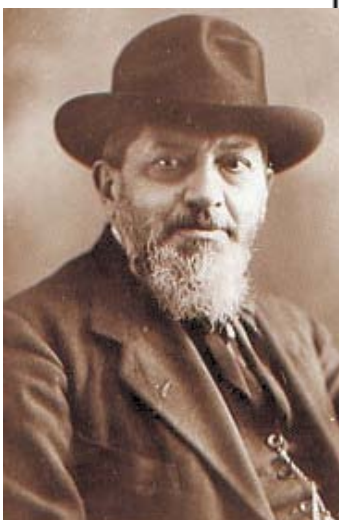
Sopra: Filippo Turati A destra un giovanissimo Palmiro Togliatti