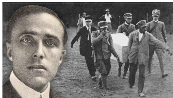
Il ritrovamento del corpo di Matteotti