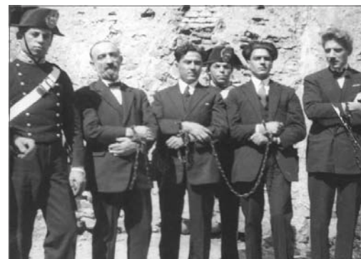
Antifascisti incatenati e avviati al confino

Nel solo periodo novembre-dicembre 1926 vi furono ben 900 assegnazioni al confino di oppositori al regime. Secondo l'art. 185 del regio decreto, il confino di polizia si estendeva da uno a cinque anni e si scontava, con l'obbligo del lavoro, in una colonia o in un comune del regno diverso dalla residenza del confinato. Con questa norma il dissenziente viene equiparato a chi ruba, uccide, o chi delinque in genere verso la persona o lo Stato. Alcune località che oggi sono rinomate mete turistiche, come Ischia, Ustica, Ponza, Tremiti, Lipari, Ventotene ed altre, divennero luoghi di confino in cui furono relegati tanti antifascisti. Fra di loro Sandro Pertini, Luigi Longo, Umberto Terracini, Altiero Spinelli, Ernesto Rossi, Giorgio Amendola, Lelio Basso, Mauro Scoccimarro, Giuseppe Romita, Eugenio Colorni, Camilla Ravera, Giuseppe Di Vittorio.